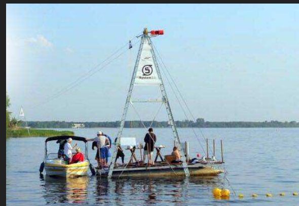
Wyciąg 2 słupowy