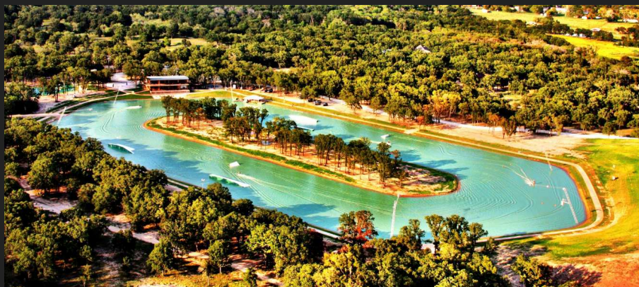
Wyciąg 4-6 słupowy